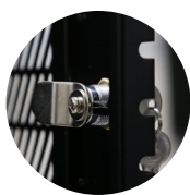
Chapa de seguridad