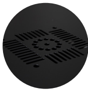
Ventanas de ventilación